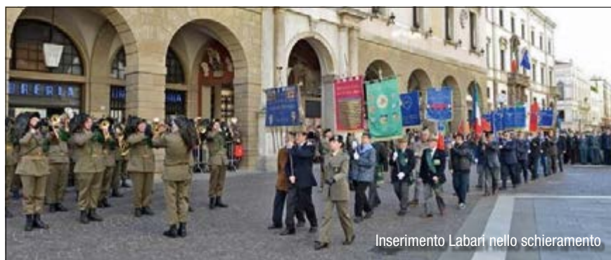
Inserimento Labari nello schieramento