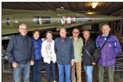
Parte del Gruppo NV nell'hangar didattico

Coe, ad oggi, è l'unica rimasta in vita (ripristinata dopo decenni, con la sola Sezione Alpha, chiaramente inattiva, cui sono state accorpate, a fini dimostrativi, anch'esse inattive, l'Area di Controllo radar e l'Area Logistica, all'epoca separate e distanti alcuni Km, ed un'Area Didattica/Illustrativa) per volontà del Comune di Folgaria, in accordo con l'Aeronautica Militare, per testimoniare il precipitato periodo storico che tenne il mondo sull'orlo del disastro nucleare. La visita, guidata, ha riscosso grande interesse dei partecipanti.