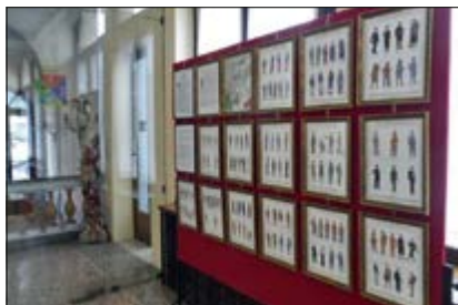
Mostra del Calendario Mauriziano al Circolo Unificato

È stata realizzata dalla Sezione di Padova dal 6 al 25 aprile presso il Circolo Unificato dell'Esercito di Padova in Prato della Valle n. 82, dove ha riscosso vivissimi apprezzamenti da parte dei Soci frequentatori e degli ospiti partecipanti alle numerose attività socio-culturali del Circolo.