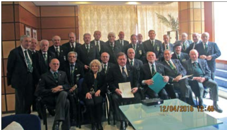
Roma, 12 aprile 2016. Riunione del Consiglio e dell'Assemblea Nazionali