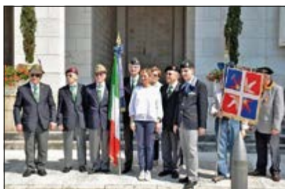
Saluto al NV dell'Assessore al Sacrario di Fagarè

24 e 25 maggio. Su invito di COMFODI-Nord, partecipazione alle Manifestazioni in Padova, organizzate e realizzate, nell'ambito del Progetto dello Stato Maggiore dell'Esercito "L'Esercito combatte", dal predetto Comando ed inaugurate, nel pomeriggio del 24, dal Comandante di COMFODI-Nord, alla presenza del Capo di Stato Maggiore della Difesa, Gen. C.A. Claudio GRAZIANO e del Capo di Stato Maggiore dell'Esercito, Gen. C.A. Danilo ERRICO (tutti prove-