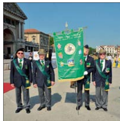
Gruppo, con Labaro, del NV di Padova, all'Alzabandiera