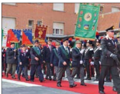
Inserimento Labari nello schieramento