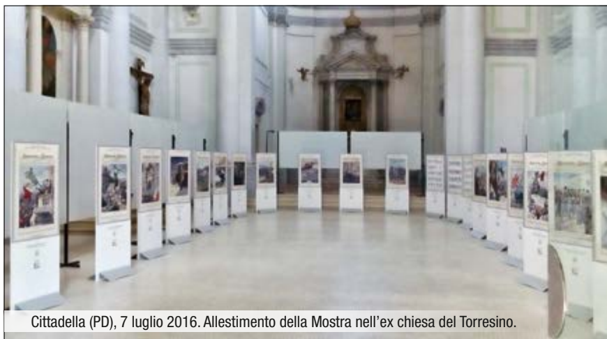
Cittadella (PD), 7 luglio 2016. Allestimento della Mostra nell'ex chiesa del Torresino.

La Mostra consiste nella realizzazione di 22 pannelli (150x70) riproducenti le "Tavole" della Domenica del Corriere su episodi molto significativi della Grande Guerra ( in parte tratti dai Calendari Mauriziani 2015 e 2016 ), da esporre in località (circa 20) delle Regioni Veneto, Friuli V.G. e Trentino A.A., entro il corrente anno. La Mostra è a cura della Tipografia Moderna di Montagnana (PD), con il concorso del Coordinatore Territoriale del Nord Est e dei Presidenti di Sezione ANNV delle predette Regioni.