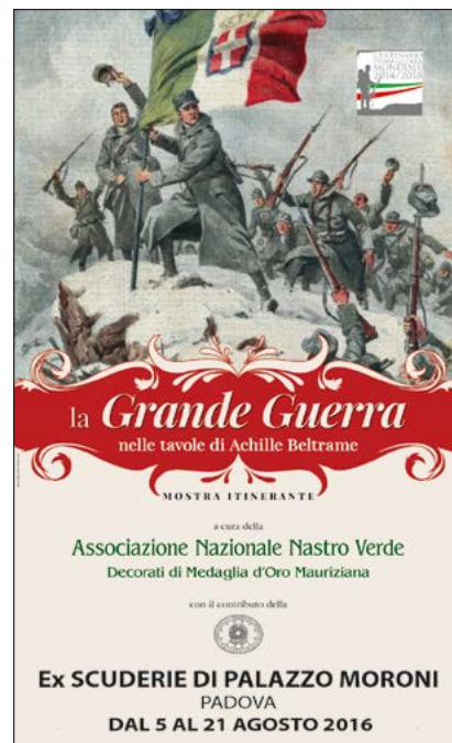
Locandina ingresso Mostra

Mostra del Calendario Storico Mauriziano 2015