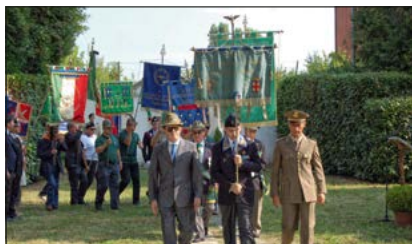
I Labari assumono lo schieramento

72° Anniversario della rappresaglia nazifascista del 17 agosto 1944