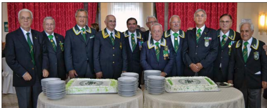
Le torte "Mauriziane" servite al termine del pranzo sociale