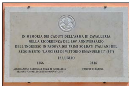
Lapide commemorativa Caduti

150° Anniversario della liberazione di Padova dalla dominazione austriaca