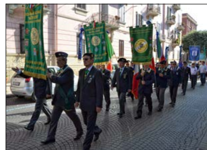
Parte della Sfilata