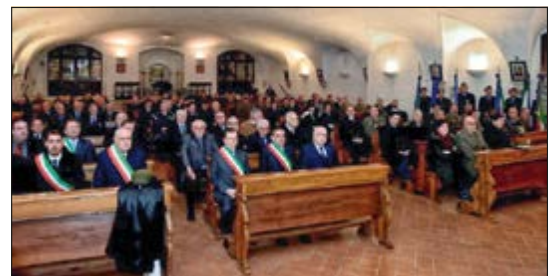
4^ Giornata Naz. UNSI - Santa Messa

della Difesa, dalle Regioni Veneto e Friuli Venezia Giulia, dalla Provincia e dal Comune di Padova, dall'Università degli Studi di Padova, unico Ateneo d'Italia decorato di M.O.V.M., da 36 Città e Comuni decorati di M.O.V.M. e da altri 31 Comuni di tutta Italia, alcuni dei quali rappresentati alla S. Messa dai rispettivi Sindaci - hanno partecipato Autorità Militari e Civili cittadine e Rappresentanze di Associazioni Combattentistiche e d'Arma di Padova e dell'UNSI di altre Città.