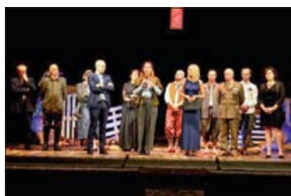
Teatro Verdi, presentazione dell'evento