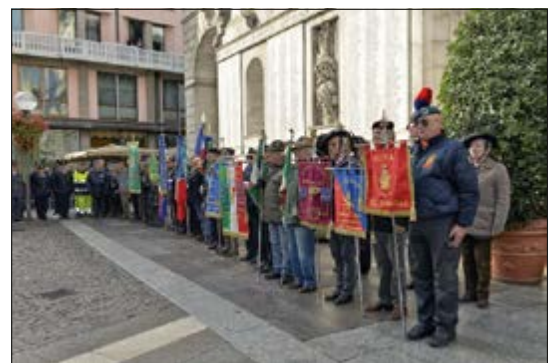
Cerimonia in Piazza del Municipio Il Nastro Verde assume lo schieramento