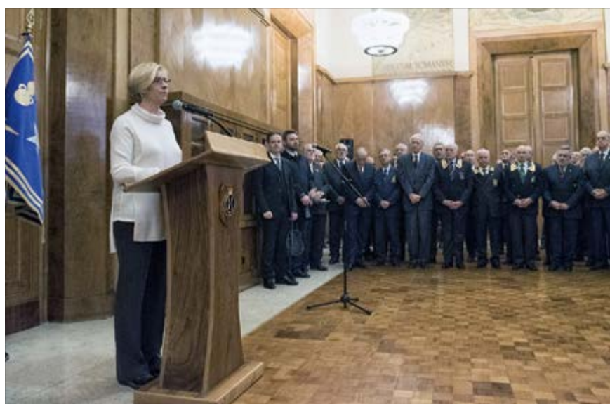
Per “Nastro Verde” erano presenti il Presidente ed il Vicepresidente Nazionali

Con questo spirito e con l’orgoglio di rappresentare appunto i Valori più alti che ci accomunano e che ci contraddistinguono, le Associazioni d’Arma si sentono onorate di formulare il loro ringraziamento per l’opera svolta nell’anno che si chiude e l’augurio più fervido per il futuro a Lei signor Ministro, - unitamente alle felicitazioni per il rinnovo del Suo alto mandato - nonché alle Autorità presenti e per esse alle Forze Armate tutte.