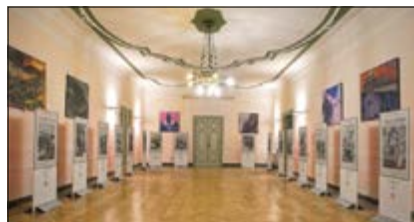
Mostra al Museo della 3 a Armata

prossimo 30 gennaio 2017. In merito al predetto Museo, la cui Direzione fa capo al Comando Forze Operative Nord dell'Esercito di Padova, ex COMFODIN (n.d.r.), si segnala che in esso sono custoditi importanti cimeli, documenti e memorie storiche della "Invitta" 3 a Armata della prima guerra mondiale. Il Museo, che è visitato anche da numerose scolaresche di tutti i livelli, è aperto al pubblico da martedì a giovedì dalle 09:00 alle 12:00 e dalle 14:00 alle 17:30, venerdì dalle 09:00 alle 13:00, domenica dalle 09:30 alle 12:30 e dalle 15:30 alle 18:30 (lunedì e sabato per appuntamento - chiuso nelle festività infrasettimanali e di fine anno), con possibilità di visite guidate gratuite su richiesta (tel. 049/8203430).