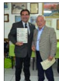
Consegna di altri attestati a Soci della Sezione Puglia, nella stessa circostanza del 18 dicembre 2016.