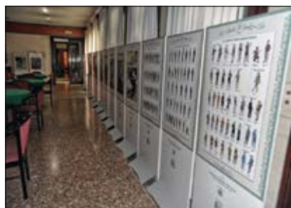
Mostra al Circolo Unificato dell'Esercito

Promosse dal Presidente della Sezione, Gen. B. Rocco PELLEGRINI, e collocate dalla nota Tipografia Moderna di Montagnana (PD), sono state realizzate mostre sulla 1 a G. M. in Padova presso il Circolo Unificato dell'Esercito (dotato anche di Foresteria) in Prato della Valle n. 82, dal 10 al 17 ottobre, dove ha riscosso vivissimi apprezzamenti da parte dei Soci e degli ospiti, e, successivamente, presso il Museo della Terza Armata, in Via Altinate n. 59, dal 5 dicembre e dove resterà fino al