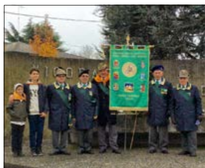
Gruppo del Nastro Verde