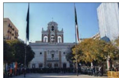
Il 4 novembre 2016, una rappresenta della Sezione Puglia ha partecipato alla cerimonia per l'anniversario delle Forze Armate.