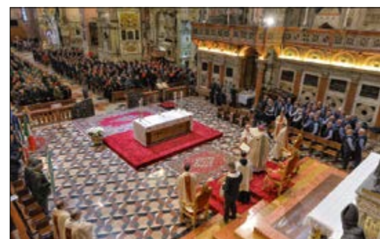
Virgo Fidelis - Partecipanti S. Messa