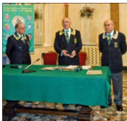
Discorso del Presidente Nazionale

L'11 dicembre, presso il Circolo Unificato dell'Esercito di Padova, alle ore 11.30, alla presenza dei numerosi Soci convenuti per partecipare al successivo pranzo,