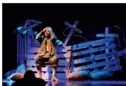
Teatro Verdi, una scena della rappresentazione