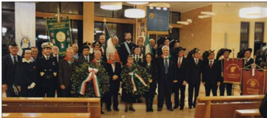
Il 4 novembre una rappresentanza della Sezione ANNV ha partecipato all'inaugurazione della Sezione Combattenti e Reduci di Taranto.