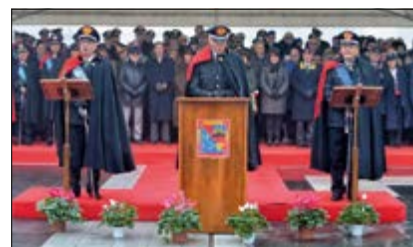
C.te Generale Arma - Allocuzione del Gen. Visone