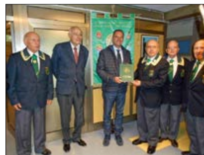
Consegna del libro al Sindaco di Padova