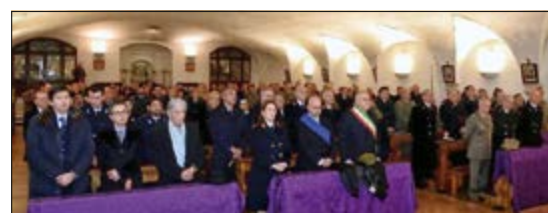
Santa Messa di Natale Interforze