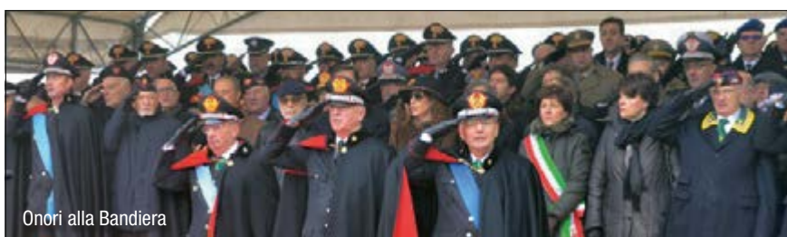
Onori alla Bandiera