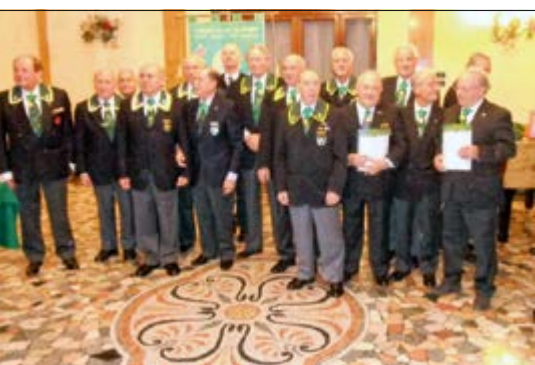
Soci in divisa sociale partecipanti alla consegna MF e Tessere