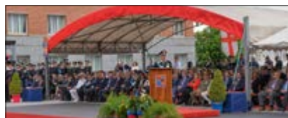
Allocuzione del Gen. C.A. Aldo VISIONE