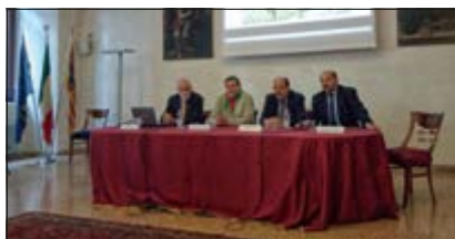
Conferenza presso il Comune