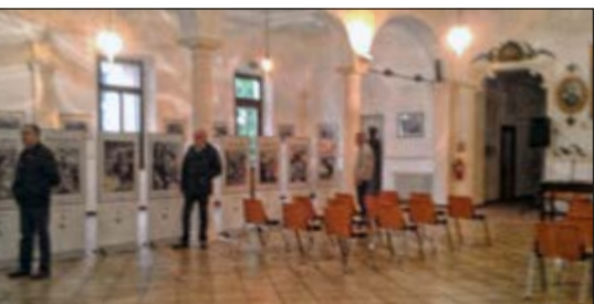
L'ampio salone delle feste con alcuni visitatori

La mostra si è conclusa il 24 aprile successivo riscuotendo un lusinghiero successo di visitatori.