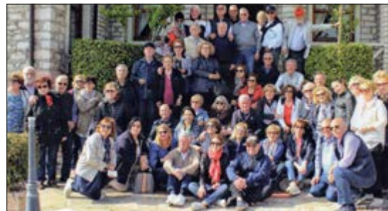
Gruppo di Soci della Sezione Puglia in gita socio-culturale a Corfù ed in Albania.