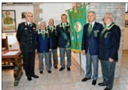
Cerimonia di consegna della Medaglia Mauriziana ai nuovi insigniti presso il Comando Legione Carabinieri Basilicata in Potenza.