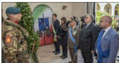
Deposizione corona al Sacrario del 58° Rgt. F.