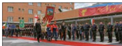
Sfilamento iniziale delle Rappresentanze (Gonfaloni della Regione Veneto, Provincia e Comune PD e Labari - Bandiere delle Associazioni d'Arma)