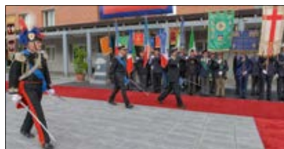
Il Gen. VISIONE rassegna lo Schieramento