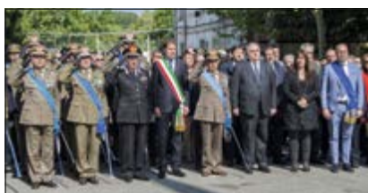
Alzabandiera - Autorità presenti