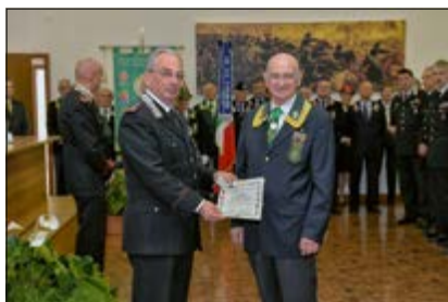
Consegna Tessera di Socio Benemerito al Gen. C.A. Aldo VISIONE