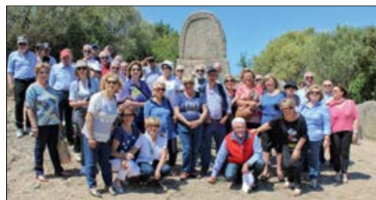
Gruppo della Sezione Puglia in gita all'Isola della Maddalena.