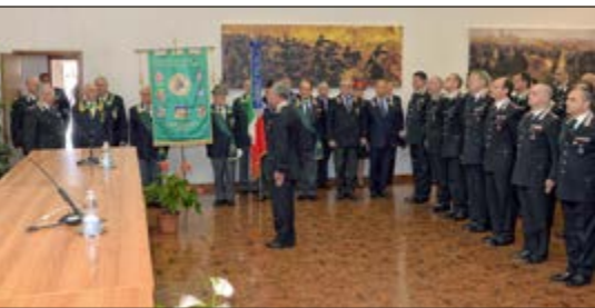
Inizio Cerimonia - Onori al Cte Interregionale