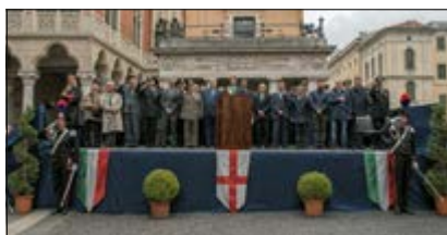
Palco Autorità - Alzabandiera