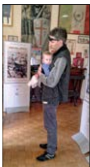
Un singolare visitatore

Il 10 aprile 2017 in Turate (CO), nel salone delle feste della Casa Militare "Umberto I", è stata inaugurata la mostra itinerante realizzata a cura della Presidenza Nazionale con il contributo della