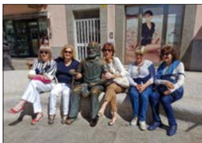
Gruppo di Dame Mauriziane in posa con la statua di Garibaldi.