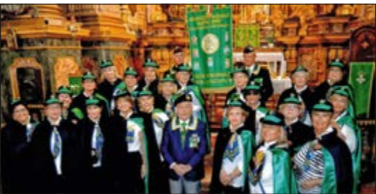
Il Gruppo delle Benemerite della Sezione Puglia all'interno della Basilica di San Maurizio, in Torino, occasione del X Raduno Nazionale.