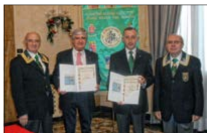
Consegna Tessere Soci d'Onore