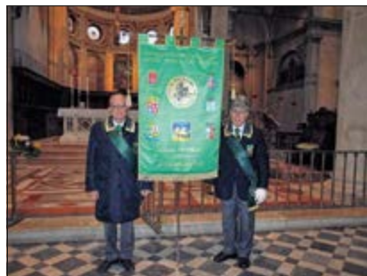
Benedizione del Labaro nell'Abbazia di Praglia (TEOLO-PD)