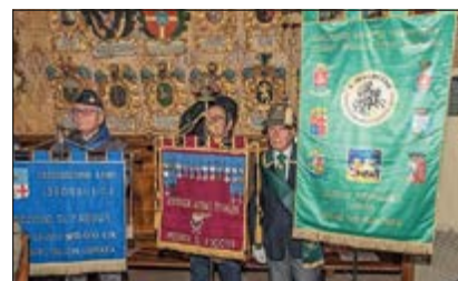
Il Labaro della Sezione N.V. schierato nell'Aula Magna