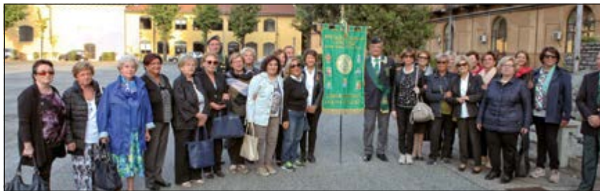
La Sezione Puglia durante la visita alla Caserma della "Cernaia" di Torino (Scuola Allievi Carabinieri).