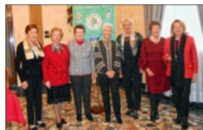
Socie e consorti di Soci partecipanti alla cerimonia