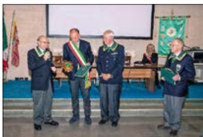
Consegna Crest e libro Storia NV al Comune