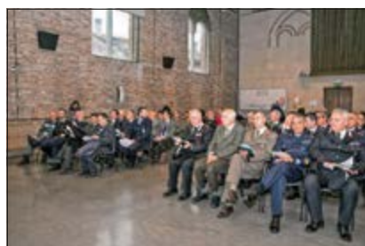
Autorità, premiandi, rappresentanze