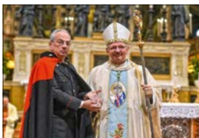
Consegna "fiamma CC" al Vescovo