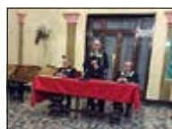
Discorso del Presidente Nazionale