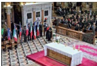
Allocuzione del Gen. VISONE

Al termine il Gen. VISONE ha consegnato al Vescovo, in ricordo della ricorrenza, la "Fiamma", simbolo dell'Arma, realizzata in vetro di Murano da maestri vetrai.