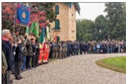
Villa Giusti - Schieramento con Autorità e pubblico

Il 4 novembre la Sezione ha partecipato, a Padova, alle due Cerimonie Interforze commemorative, organizzate dal COMFOP Nord e dal Comune, nel corso delle quali sono state deposte corone sulle lapidi che ricordano i Caduti, svoltesi alla pre-