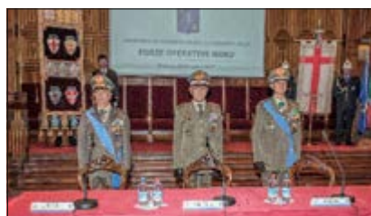
Il Capo di SME e i Comandanti cedente e subentrante