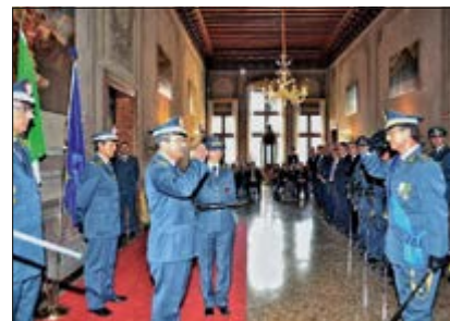
Parte degli insigniti, con familiari