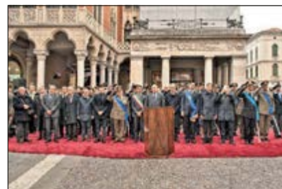
Piazza del Municipio - Autorità all'Alzabandiera