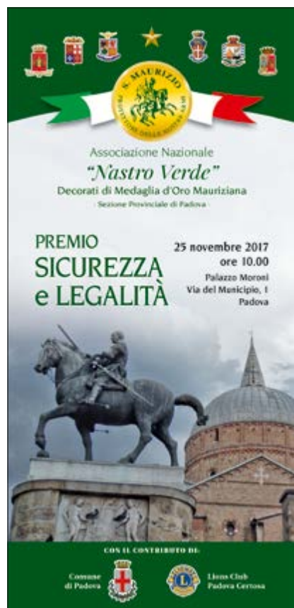
Premio Sicurezza e Legalità - Frontespizio Invito-Programma