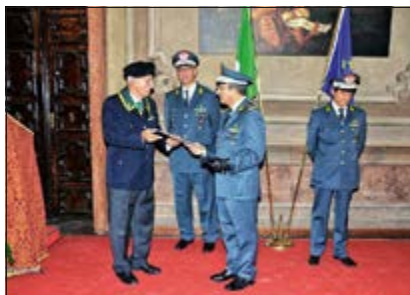
Consegna del Calendario