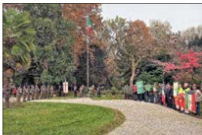
Villa Giusti - Schieramento Associazioni