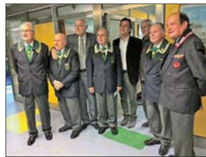
Il Sindaco ed il Presidente di Assoarma, con la Rappresentanza del Nastro Verde, davanti alla sede della Sezione