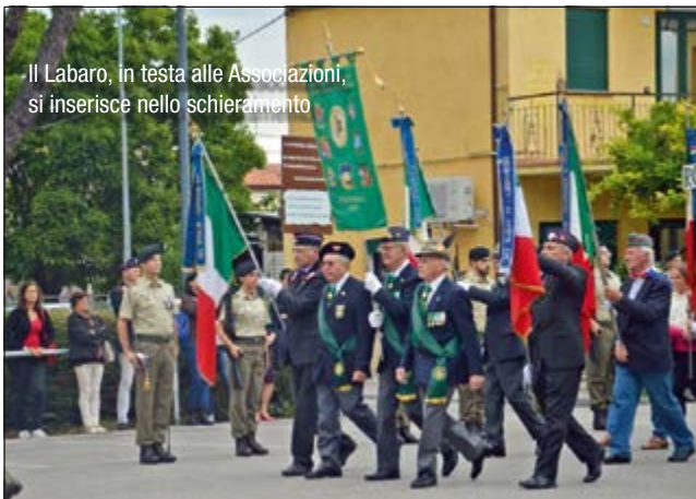
Il Labaro, in testa alle Associazioni, si inserisce nello schieramento