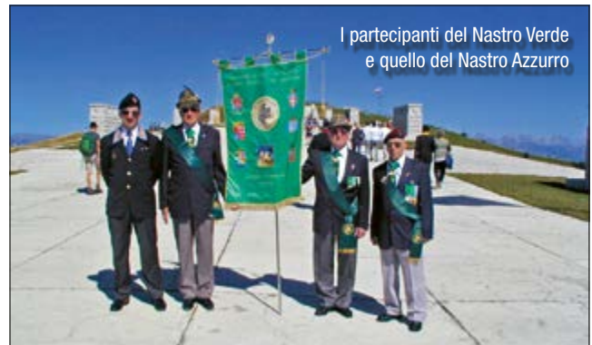
I partecipanti del Nastro Verde e quello del Nastro Azzurro