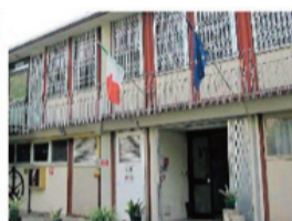
NA CRALBERTI L'ex scuola Madonna di Lourdes gestita dalle associazioni militari: è un museo che ospita la loro storia